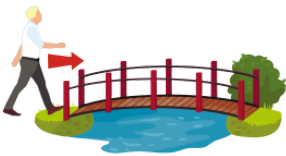
わたります [はしを] cross [a bridge]