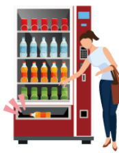
でます [ジュースが] [juice] come out