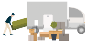
ひっこしします move (house)