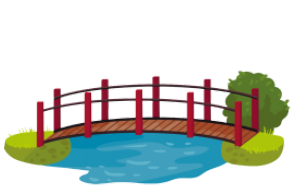
はし hashi bridge