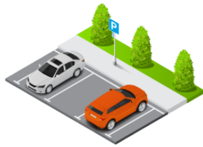
ちゅうしゃじょう chūshajō parking lot