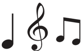
おと oto sound