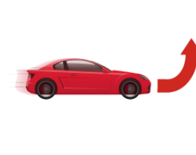
うごきます [くるまが] ugokimasu(kurumaga) [a car] move, work