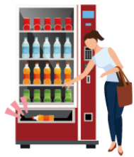
でます [ジュースが] demasu(jūsuga) [juice] come out