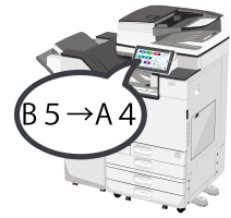
かえます kaemasu change