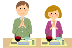
ごちそうさま(でした)。 gochisōsama(deshita). That was delicious.