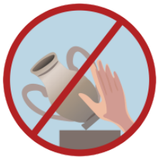
さわります [に] sawarimasu(ni) touch