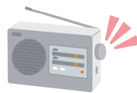
つまみ tsumami knob