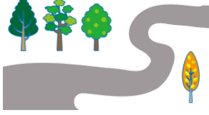
みち michi road, way