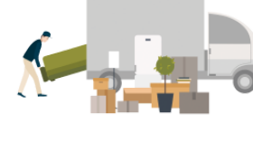
ひっこしします hikkoshishimasu move (house)