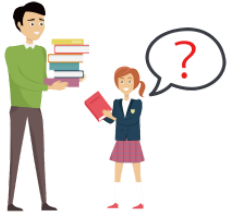
ききます [せんせいに] kikimasu(sensēni) ask [the teacher]