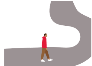
あるきます [みちを] arukimasu(michiwo) walk [along a road]