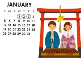
(お)しょうがつ (o)shōgatsu New year's day