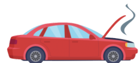
こしょう koshō break down