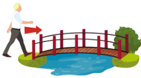
わたります [はしを] watarimasu(hashiwo) cross [a bridge]