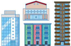
たてもの tatemono building