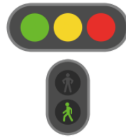
しんごう shingō traffic light