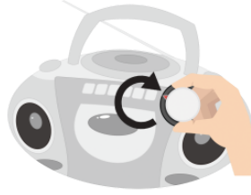
まわします mawashimasu turn