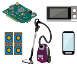
きかい kikai machine