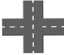
こうさてん kōsaten crossroad