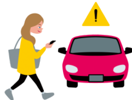
きをつけます kiwotsukemasu pay attention