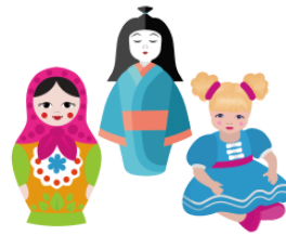
にんぎょう ningyō doll