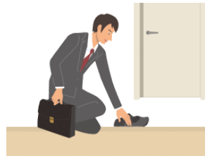
げんかん genkan front door