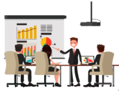
ミーティング mīthingu meeting