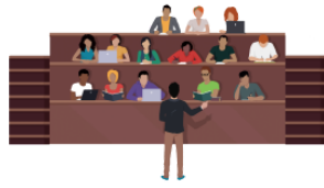
こうぎ kōgi lecture