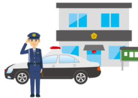
こうばん kōban police box