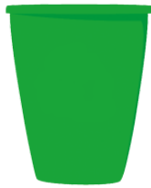
ごみばこ gomibako trash box