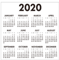
カレンダー karendā calendar