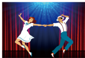
ミュージカル myūjikaru musical