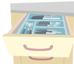
ひきだし hikidashi drawer