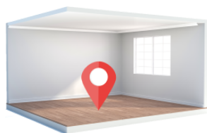
まんなか mannaka center