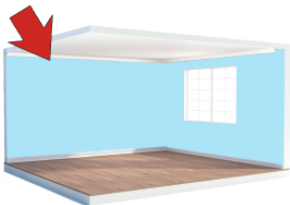
かべ kabe wall