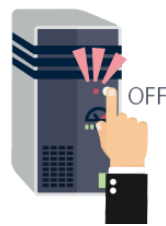
きります [でんげんを] kirimasu(dengenwo) turn off [the power switch]