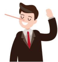
うそ uso lie