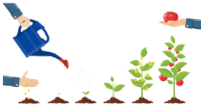
そだてます sodatemasu breed, bring up