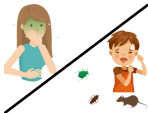
きもちがわるい kimochiga warui unpleasant