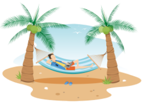
きもちがいい kimochigāi pleasant, agreeable