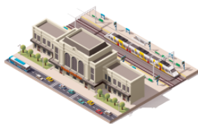
えきまえ ekimae the area in front of the station