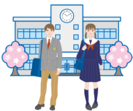
ちゅうがっこう chūgakkō middle school