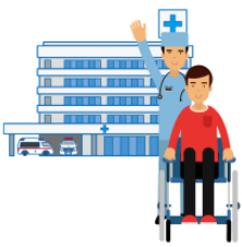
たいいんします taīnshimasu leave hospital