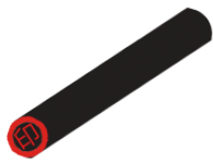
はんこ hanko seal stamp