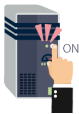
いれます [でんげんを] iremasu(dengenwo) turn on [the power switch]