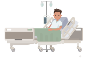
にゅういんします nyūinshimasu enter hospital