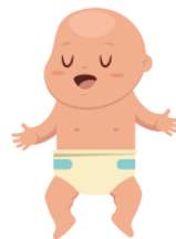
あかちゃん akachan baby