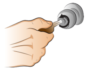
かけます [かぎを] kakemasu(kagiwo) lock