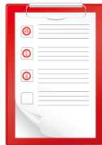
かいらん kairan circular