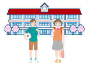
しょうがっこう shōgakkō elementary school