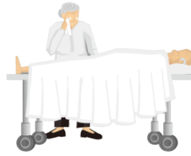
なくなります nakunarimasu pass away