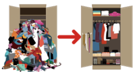
せいりします sērishimasu put (things) in order, tidy up