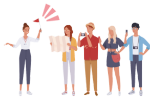
ガイド gaido guide