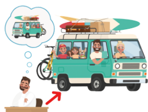
かないます [ゆめが] kanaimasu(yumega) [dream] come true