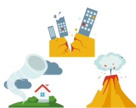
しぜん shizen nature