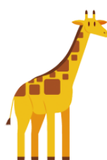
きりん kirin giraffe