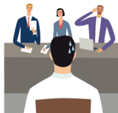
きんちょうします kinchōshimasu become tense