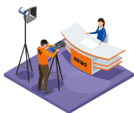
とります [ビデオに] torimasu(bideoni) record [on video]