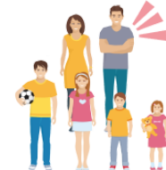
おとうさん someone else's father