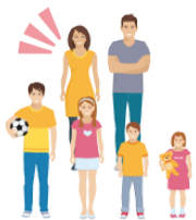
おかあさん someone else's mother