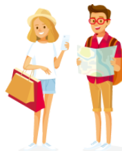
りょこう trip, tour