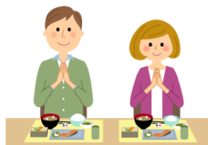
いただきます。 Thank you. (before eat/drink)