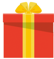
プレゼント present, gift