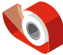
セロテープ scotch tape