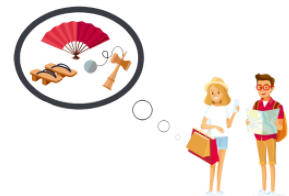
(お)みやげ souvenir, present