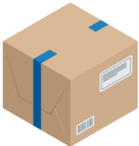
にもつ baggage, parcel