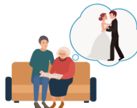
おもいだします remember, recollect