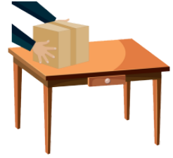
おきます put on