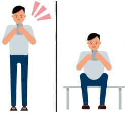
たちます stand up