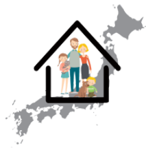
すみます be going to live