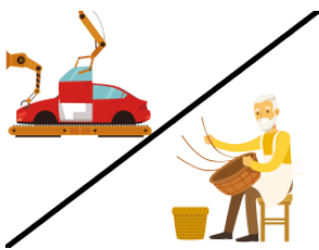
つくります make, produce