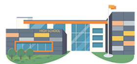
こうこう high school