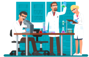
けんきゅうします do research