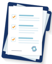
しりょう materials, data