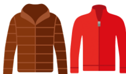
うわぎ uwagi jacket