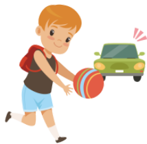
あぶない abunai dangerous