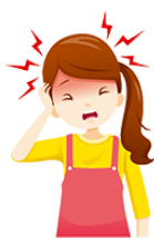
いたいです [あたま]が itaidesu(atamaga) headache