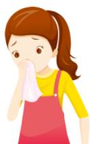
かぜ kaze cold, flu