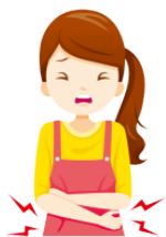
いたいです [おなか]が itaidesu(onakaga) stomachache