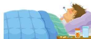
びょうき byōki illness, disease