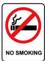
きんえん kinen no smoking