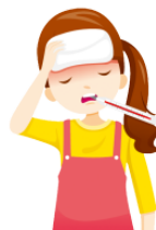
ねつ netsu fever