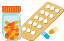
くすり kusuri medicine