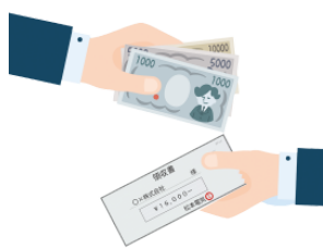
りょうしゅうしょ ryōshūsho receipt