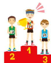
ゆうしょうします yūshōshimasu win the championship