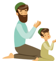
しんじます shinjimasu believe, trust