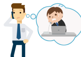
まちがいでんわ machigaidenwa wrong number