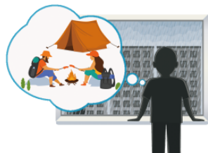
ちゅうし chūshi calling off