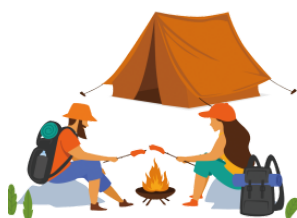
キャンプ kyanpu camp