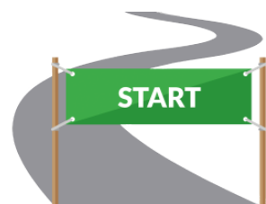
スタート sutāto start