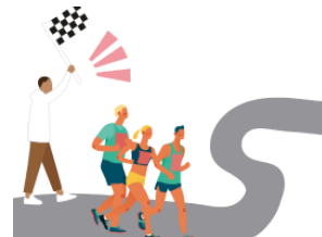
かかりいん kakarīn person in charge, attendant