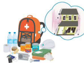
よういします yōishimasu prepare