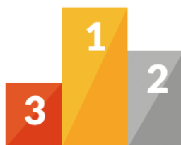
～い ～i ～st, ~nd