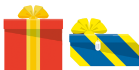
おくりもの okurimono gift