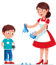
あやまります ayamarimasu apologize