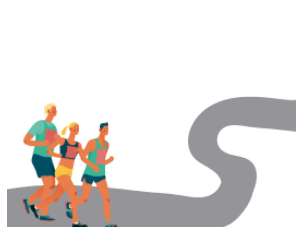
コース kōsu course