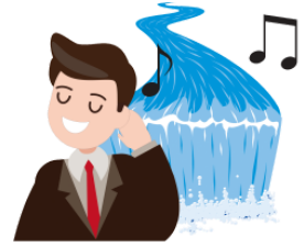
します [おとが] shimasu(otoga) [sound/voice] be heard