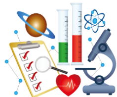
かがく kagaku science