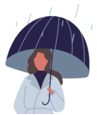
さします [かさを] sashimasu(kasawo) put up [an umbrella]