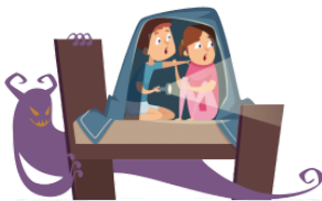
こわい kowai frightening