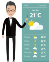
てんきよほう tenkiyohō weather forecast