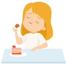
します [あじが] shimasu(ajiga) taste