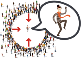
あつまります [ひとが] atsumarimasu(hitoga) [people] gather