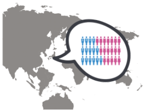
じんこう jinkō population