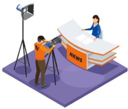
とります [ビデオに] record [on video]