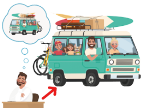
かないます [ゆめが] [dream] come true