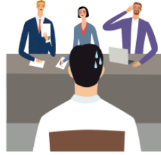
きんちょうします become tense